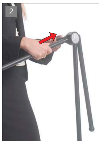
脚を本体ボールへ差し込みます。