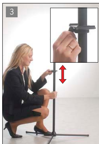
取り付けカバネルまたはボードの場合 最下部の位置を先に決めます。