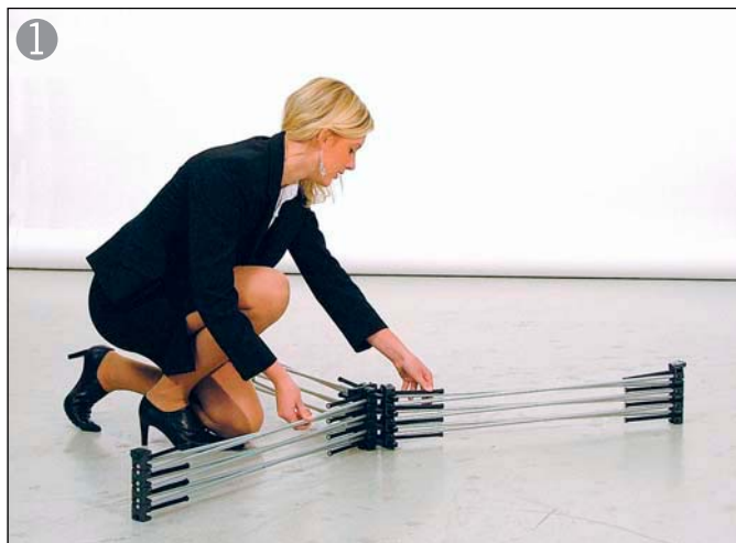
① 畳まれているストラクチャーを写真の様に3方向に広げます 中央部分を両手で持ち引き上げます