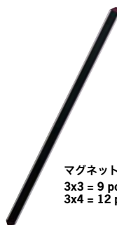
マグネットバー 3x3 = 9 pcs. 3x4 = 12 pcs.