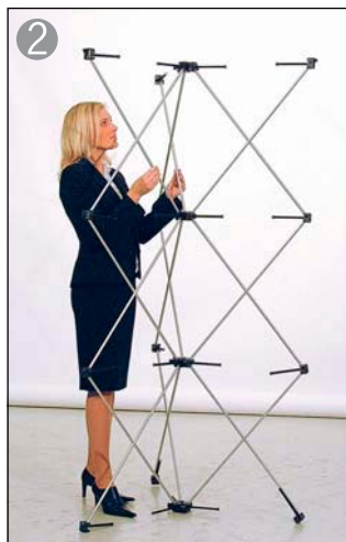
② マグネットロックを吸着します