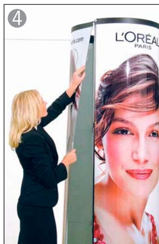
④ パネルをフックに掛けて止めます (※1)