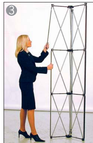
③ マグネットバーを取り付けます 溝に確実に嵌め込む様にします