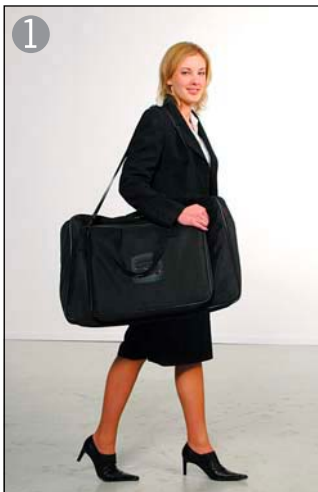
1 付属のショルダーバックで移動もスムーズです