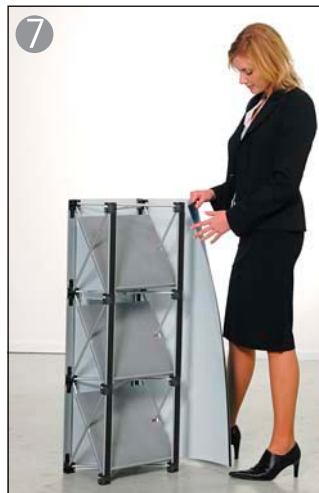
7 左右のグラフィックパネルも、同様に取り付けます※2