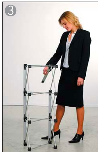
3 最初に正面となる側のマグネットバーを取り付けます※1