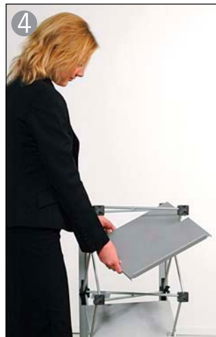
4 棚板を板の切れ目に沿ってセットします