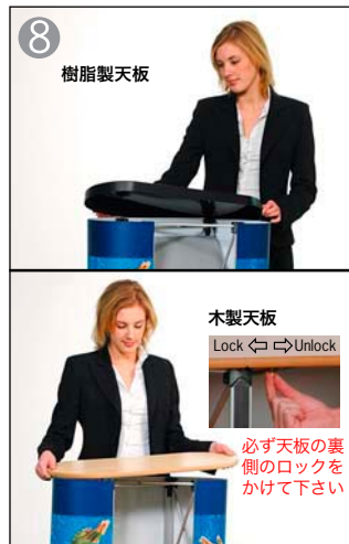
8 最後に天板を被せ完成です 取り外しは組み立て方の逆に行なってください