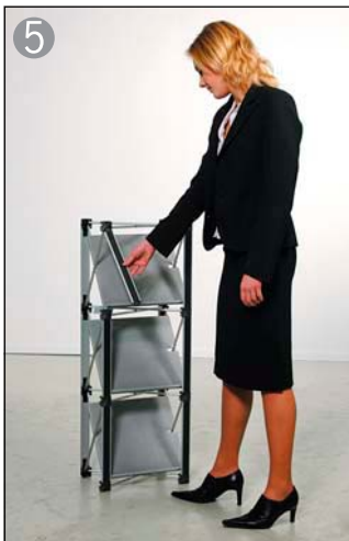
5 棚板の手前もマグネットバーを取り付けます