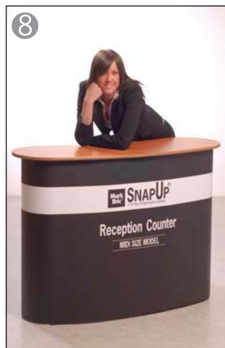
8 取り外しは組み立て方の逆に行なってください※1