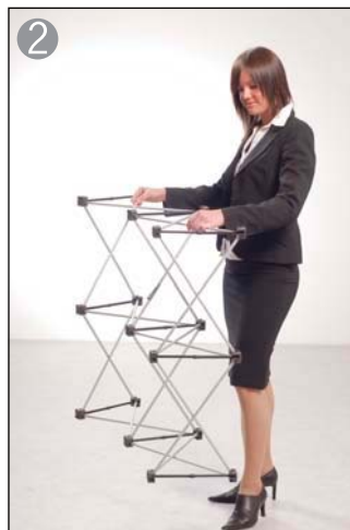
2 ストラクチャーを引き上げマグネットロックを吸着します