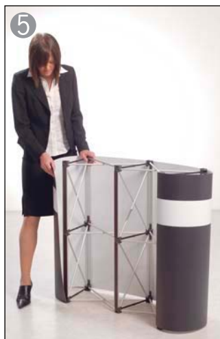
5 続いてサイド側にグラフィックパネルを、吸着していきます