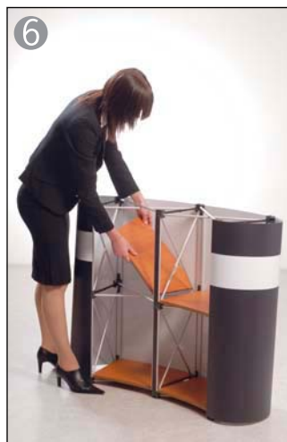
6 棚板を4枚とも乗せます