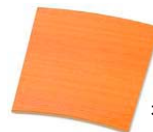
木製棚板 4 pcs.