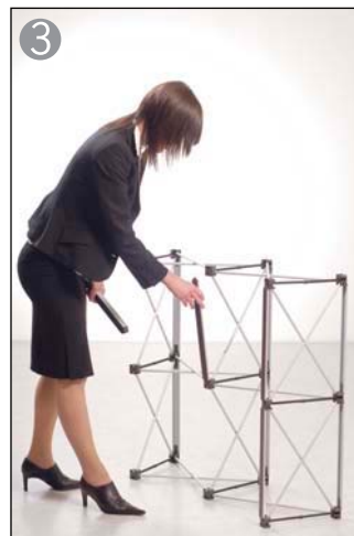
3 マグネットバーを全て取り付けていきます※1