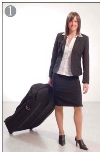
1 キャスター付きの専用バッグで移動もスムーズ