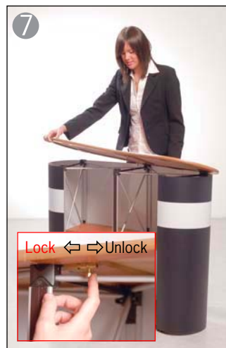
7 パネル、棚板の取り付けが終了してから天板を乗せます※2