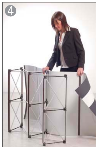
4 フロント側からグラフィックパネルをマグネットバーに吸着します