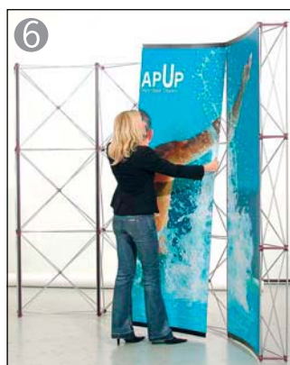
6 パネルをフックに掛けて止めます ※1