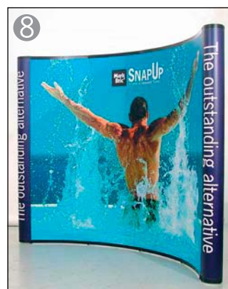
8 絵柄のつながり確認して完成です

※1 グラフィックパネルは中央のパネルから、フックに引っ掛けマグネットバーのセンターにある溝に沿って、ゆっくり吸着させて行きます。同様に左右のグラフィックパネルも取り付けると、綺麗に絵柄が揃います。