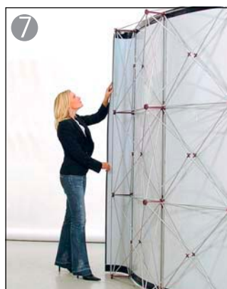
7 同様にエンドパネルを掛けます ※2