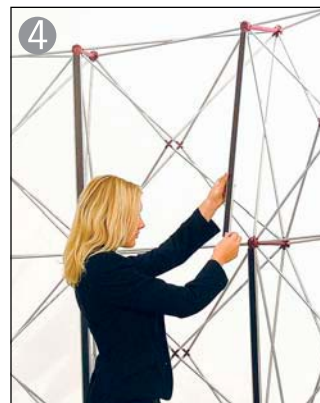
4 マグネットバーを取り付けます溝に嵌め込む様になります