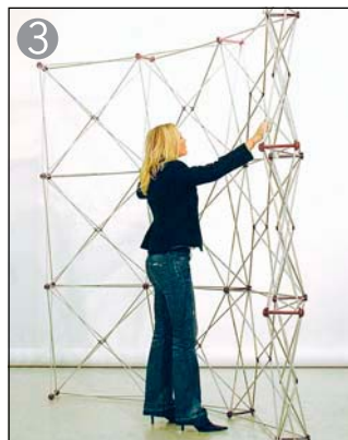
3 自然に吸着しない所は、手で止めます