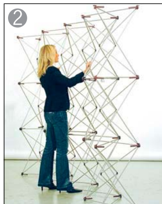
2 フレームが広がるとマグネットロックが吸着していきます