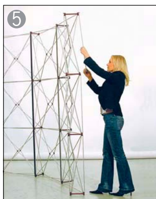
5 エンドリヤ部分も作業します