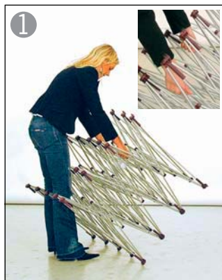
1 ストラクチャー中央部分を両手で持ち広げます