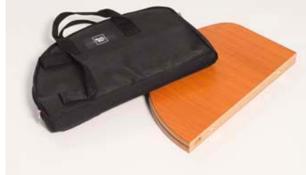
折りたたみ式ウッドテーブルトップ (オプション)