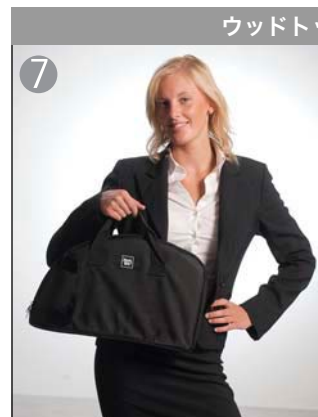
ウッドトップ-オプション